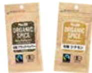
S&B ブラックペッパー シナモンなど